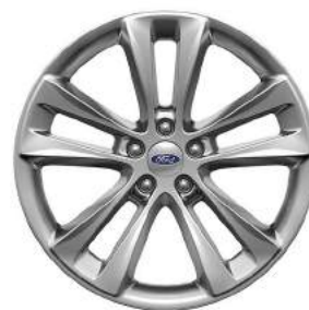
XLT Rines de Aluminio de 18 Pulgadas