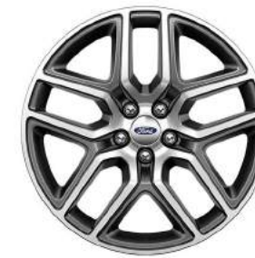
Sport 4WD Rines de Aluminio de 20 Pulgadas