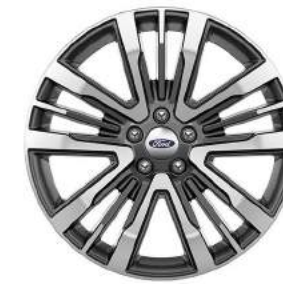
Platinum 4WD Rines de Aluminio de 20 Pulgadas