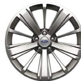
Limited FWD Rines de Aluminio de 20 Pulgadas