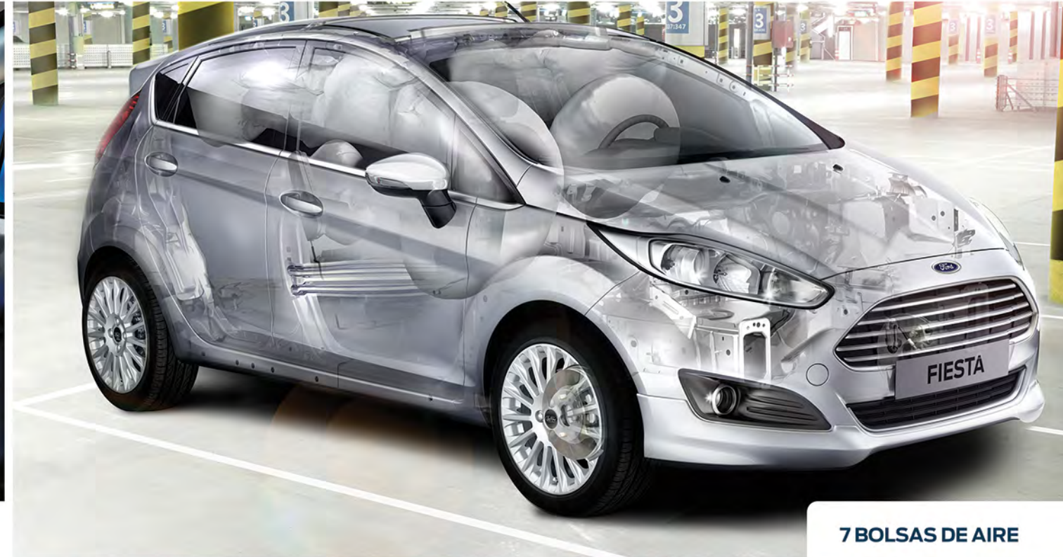
7 BOLSAS DE AIRE