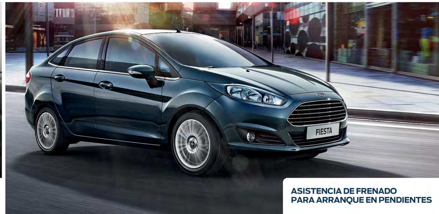
ASISTENCIA DE FRENADO PARA ARRANQUE EN PENDIENTES