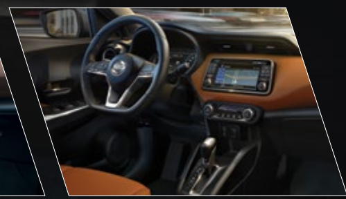
INTERIOR CON PIEL NARANJA