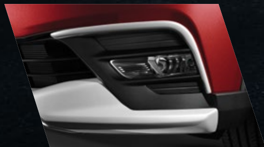
VISTAS FRONTALES Y TRASERAS