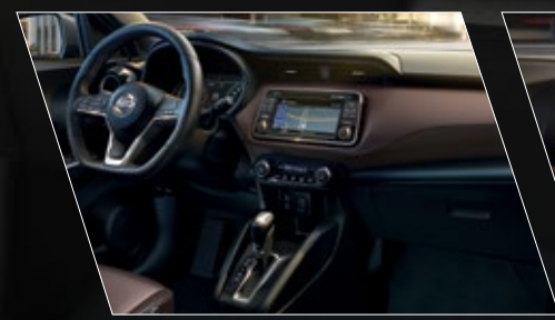
INTERIOR CON PIEL CAFÉ

El modo Sport de Nissan Kicks® brinda una mejor respuesta del motor y una aceleración más efectiva.