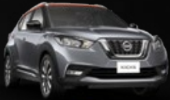
GRIS OXFORD/ NARANJA METÁLICO