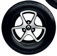
Rin Ártica Negro (Techno/Carga)