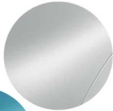
Blanco Nieve (Techno/Carga)