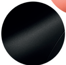
Negro Noche (Techno/Carga)