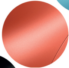
Rojo Atardecer (Techno)