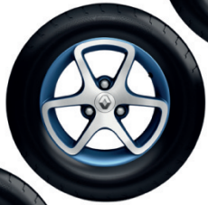
Rin Ártica Azul (Techno)