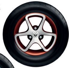
Rin Ártica Rojo (Techno)