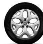
Rin de aluminio 17".