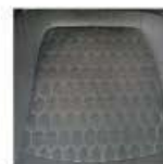
Asiento de tela.