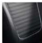
Asiento tipo piel.