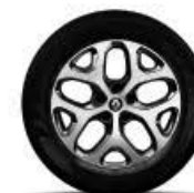
Rin de aluminio bitono 17".