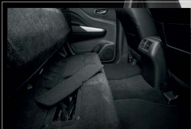
Compartimiento trasero debajo de los asientos