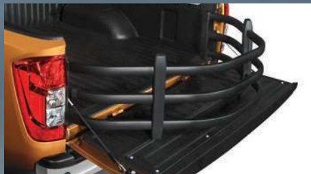
Extensor de caja

Equipa tu Nissan NP300 Frontier® con nuestra línea de Accesorios Originales Nissan.