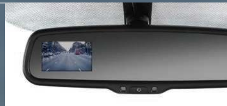
Cámara de reversa en espejo retrovisor