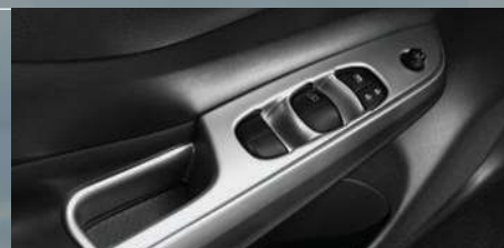
Molduras interiores en descansabrazos