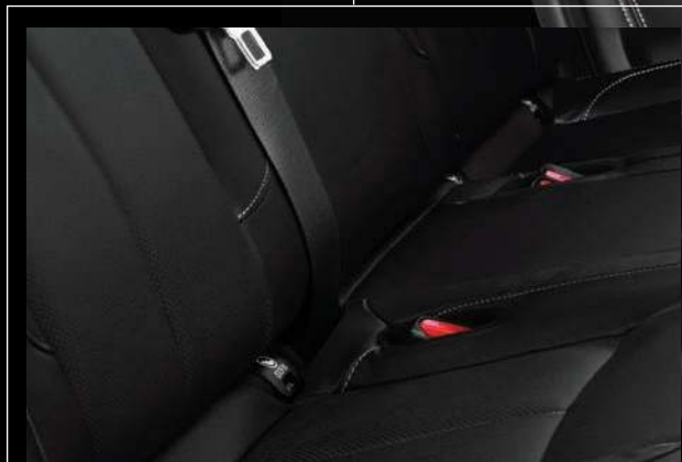
Sistema de anclaje para silla de bebé (ISO-FIX)