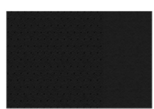
VESTIDURAS EN PIEL 'CLAUDIA'

SI NO ESTÁS SATISFECHO CON EL SERVICIO POSTVENTA, NO LO PAGAS.