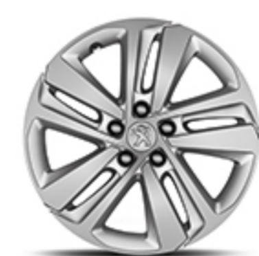
RINES DE ALUMINIO DE 17" PHOENIX