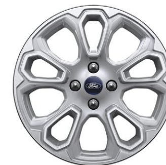
Titanium Rines de Aluminio de 17 Pulgadas