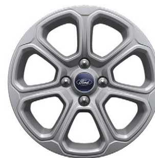
Impulse, Trend TM y Trend TA Rines de Aluminio de 16 Pulgadas