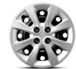
Rines de acero de 15" 185/65