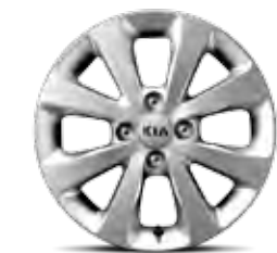
Rines de aluminio de 15" 185/65