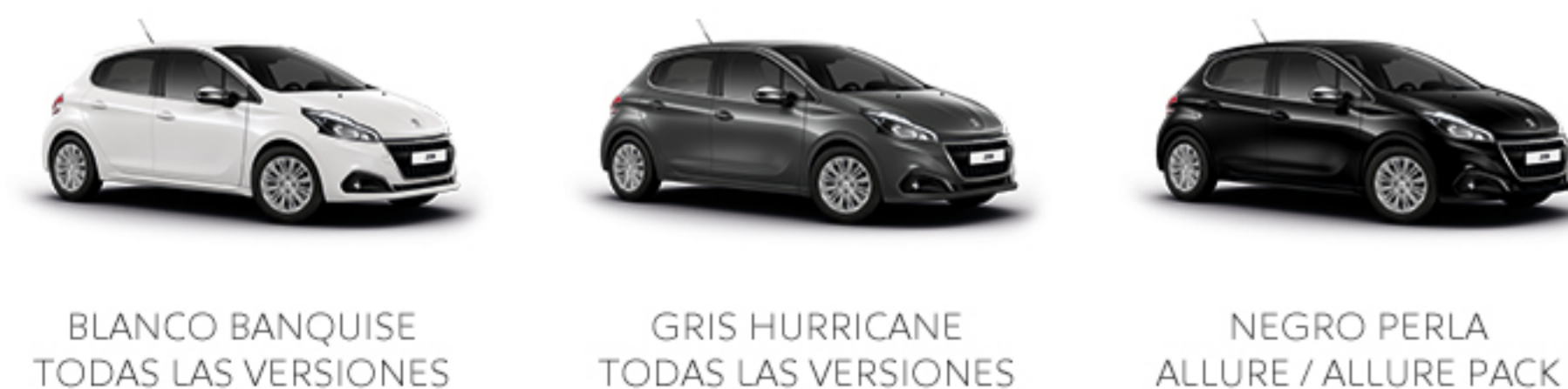
BLANCO BANQUISE TODAS LAS VERSIONES GRIS HURRICANE TODAS LAS VERSIONES NEGRO PERLA ALLURE / ALLURE PACK