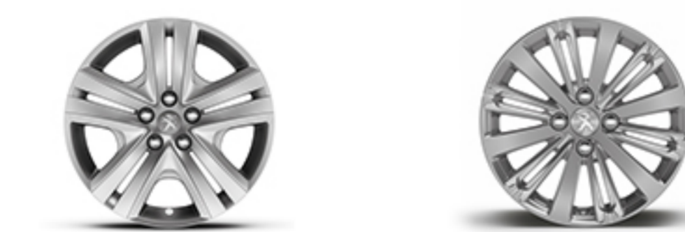
RINES DE ACERO DE 16" ZIRCONIUM ACTIVE RINES DE ALUMINIO DE 16" TITANE ALLURE / ALLURE PACK