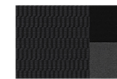
ASIENTOS EN TELA TODAS LAS VERSIONES

SI NO ESTÁS SATISFECHO CON EL SERVICIO POSTVENTA, PEUGEOT CUMPLE NO LO PAGAS.